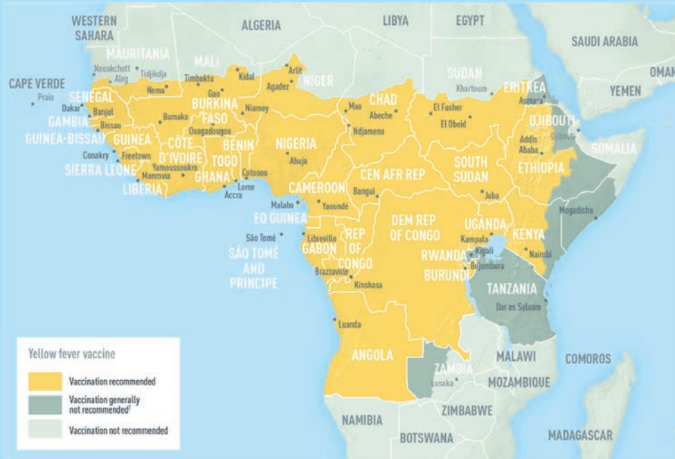
reference : CDC Yellow Book 2018

3. พิจารณาว่าประเทศที่จะไปนั้นอยู่ในพื้นที่เสี่ยงต่อการติดเชื้อไข้กาฬหลังแอ่นหรือไม่ โรคนี้เป็นโรคประจำถิ่นของบางประเทศในแอฟริกา ติดต่อกันโดยการสัมผัสละอองฝอยจากน้ำมูก น้ำลาย หรือสารคัดหลั่งของผู้ป่วย หรือผู้ที่เป็นพาหะ โรคนี้สามารถทำให้เกิดอาการรุนแรง ถ้านักท่องเที่ยวจะเดินทางไปพื้นที่ดังกล่าว และมีโอกาสสัมผัสบุคคลกับคนจำนวนมาก ควรปรึกษาแพทย์เพื่อพิจารณาฉีดวัคซีนดังกล่าว