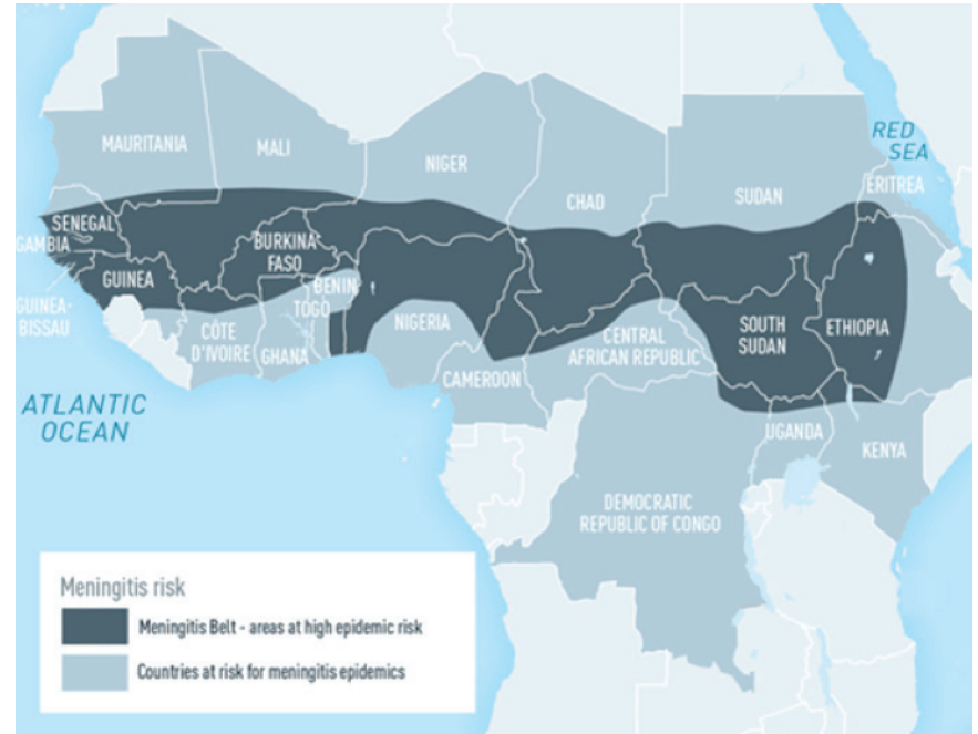
reference : CDC Yellow Book 2018

4. ระวังโรคมาลาเรีย เนื่องจากแหล่งท่องเที่ยวหลายแห่งในแอฟริกาอยู่ในพื้นที่เสี่ยงสูงในการติดเชื้อมาลาเรีย เช่น ประเทศเคนยา เอธิโอเปีย แทนซาเนีย โมซัมบิก นามิเบีย แซมเบีย ซิมบับเว น้ำตกวิกตอเรีย มาดากัสการ์ ไนจีเรีย รวันดา ฯลฯ ดังนั้นนักท่องเที่ยวควรศึกษาวิธีป้องกันให้ดี และควรปรึกษาแพทย์ก่อนการเดินทาง